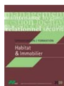
Habitat & Immobilier

L'ACET assure plus de 1 000 jours de formation par an dans ces trois grands secteurs.