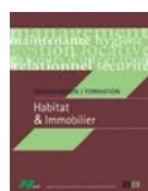
Habitat & Immobilier

L'ACET assure plus de 1 000 jours de formation par an dans ces trois grands secteurs.