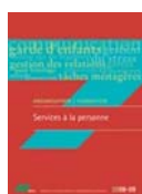
Services à la personne